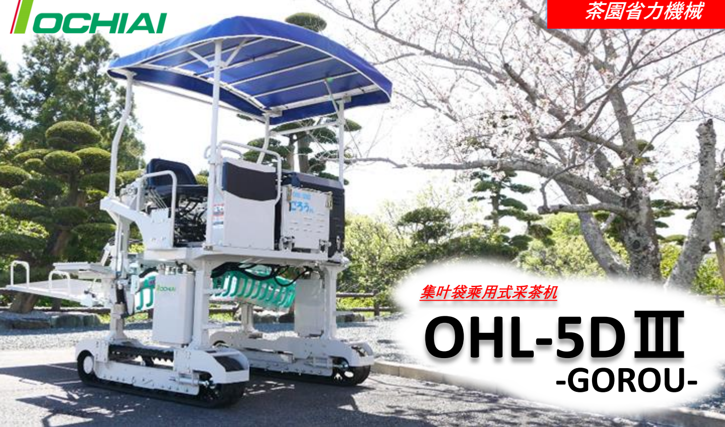
集叶袋乘用式采茶机